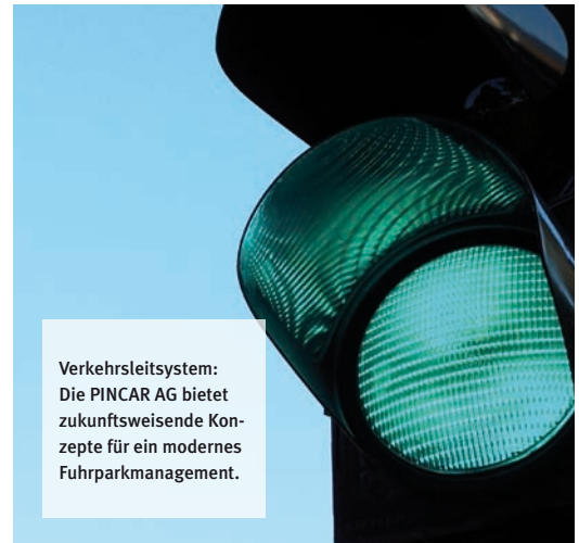
Verkehrsleitsystem: Die PINCAR AG bietet zukunftsweisende Konzepte für ein modernes Fuhrparkmanagement.

Jahr eine Plattform für fachlichen Austausch, interessante Gespräche über Trends der Branche und wertvolle Anregungen für die Praxis.