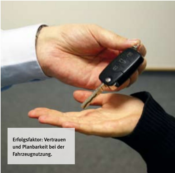
Erfolgsfaktor: Vertrauen und Planbarkeit bei der Fahrzeugnutzung.

Ziel eines modernen Personalmanagements ist es, Mitarbeiter, Teams und das gesamte Unternehmen kontinuierlich zu fördern und so stetig effizienter und erfolgreicher zu machen.