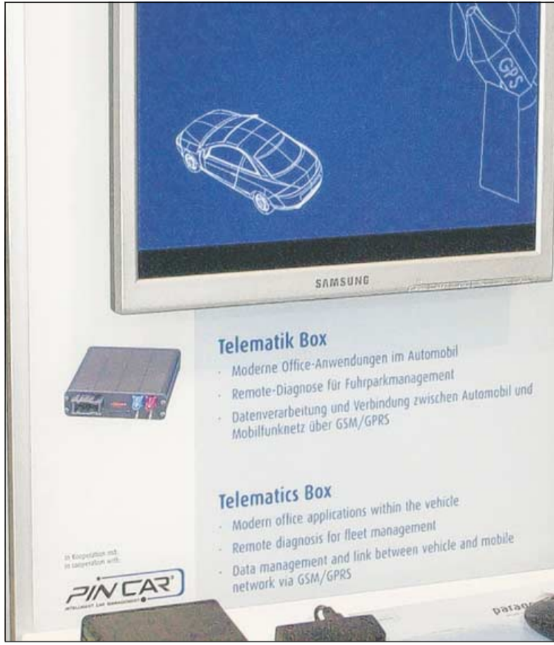
In solchen kleinen schwarzen Boxen steckt das Pincar-Geheimnis.

„Gerade im Fahrzeugmanagement mangelt es bei Unternehmen vielfach an Transparenz und so belasten anfallende Unterhalts-, Betriebs- und War-